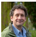
セシル・コナイネダイク Cecil Konijnendijk

コナイネダイク氏にも登壇いただき、国際的な視点と国内の動向を交差（相互参照: Cross Reference）させながら、都市・地域のあるべき姿と専門家の役割について議論を深めます。